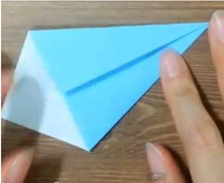
Forma la base aquilone