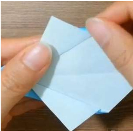
Piega a valle gli angoli