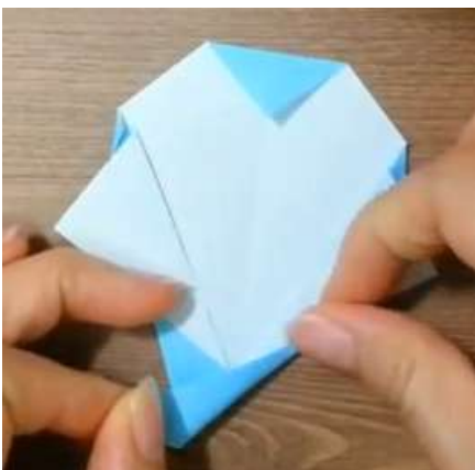
Piega la codina a valle