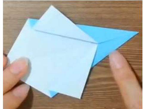
Piega a valle