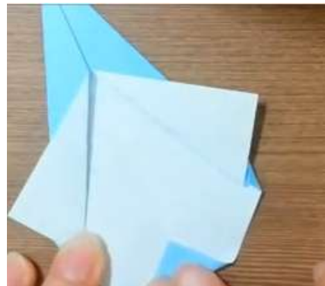
Piega in avanti la punta